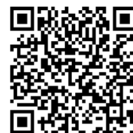
合格発表サイト QR コード