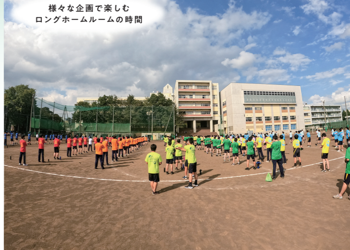
様々な企画で楽しむ ロングホームルームの時間