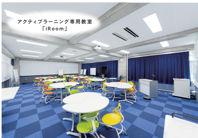
アクティブラーニング専用教室 「iRoom」