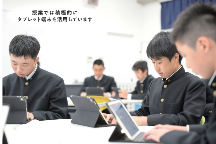
授業では積極的に タブレット端末を活用しています