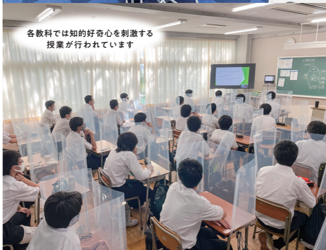
各教科では知的好奇心を刺激する 授業が行われています