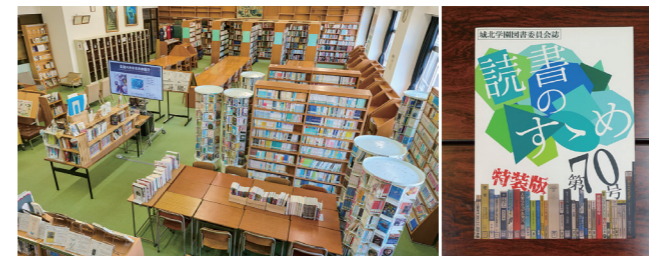
②中高共通の図書館で、蔵書は約6万冊。雑誌は部活動関連のものを中心に50種以上も。試験前になると自習で利用する生徒も多くなります。

所在地:東京都板橋区東新町2-28-1 アクセス:東武東上線「上板橋駅」徒歩10分、地下鉄有楽町線・副都心線「小竹向原駅」徒歩20分 TEL:03-3956-3157 URL:https://www.johoku.ac.jp/